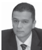
Sorin GRINDEANU Viceprimarul Timișoarei

C artier cu nume împărătesc, Iosefinul are valențe istorice deosebite, care îi conferă un loc special în peisajul urbei noastre.